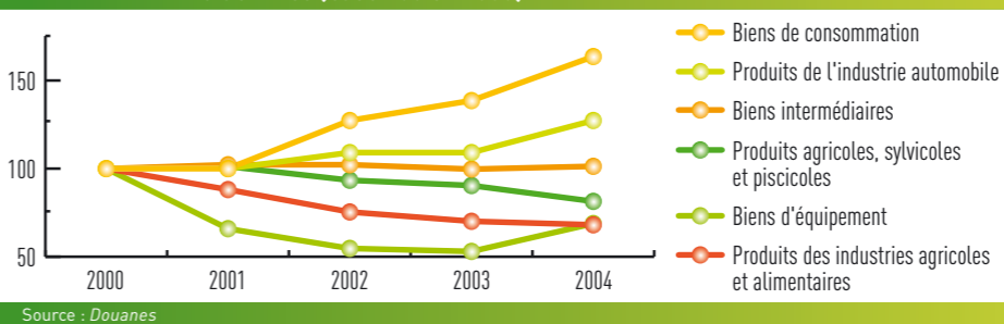
GRAPHIQUE 1 • Évolution de la valeur des exportations finistériennes par branche d'activités (base 100 en 2000)