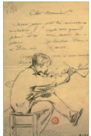
Photo : Lettre autographe du peintre Luc-Olivier Merson (1846-1920) mécénat de la société BIC pour le catalogage et la numérisation de lettres et d'autographes d'artistes conservés à la Bibliothèque de l'INHA - collections Jacques Doucet.