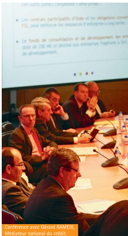
Conférence avec Gérard RAMEIX, Médiateur national du crédit.

Organisée par CCI 29, en partenariat avec la Banque de France, la Chambre de Métiers et de l'Artisanat du Finistère, l'Union des Entreprises du Finistère, la conférence sur le thème « Favoriser la reprise économique : les dispositifs de prévention et de soutien aux entreprises » a rencontré un vif succès avec plus de 150 invités présents. À cette occasion, la CCI de Quimper Cornouaille a accueilli Gérard RAMEIX, Médiateur national du crédit.