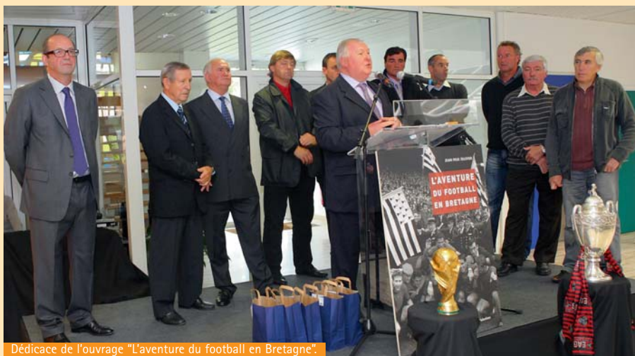
Dédicace de l'ouvrage "L'aventure du football en Bretagne".

Parrainée par Raymond KOPA, l'un des plus célèbres footballeurs français au monde, la présentation officielle de l'ouvrage « L'aventure du Football en Bretagne » de Jean-Paul OLLIVIER a attiré plus de 300 personnes. Un moment riche en émotion.