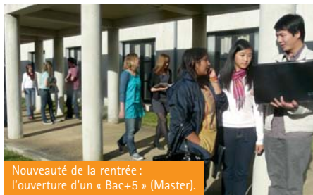
Nouveauté de la rentrée : l'ouverture d'un « Bac+5 » (Master).

Le MOCI « Classement des Formations au Commerce International », l'un des plus réputés dans le domaine international, vient de paraître. Dans ce palmarès, le Cursus ISUGA (Management Europe-Asie) de l'Ecole de Management Bretagne Atlantique, se classe parmi les 5 meilleures Grandes Écoles.