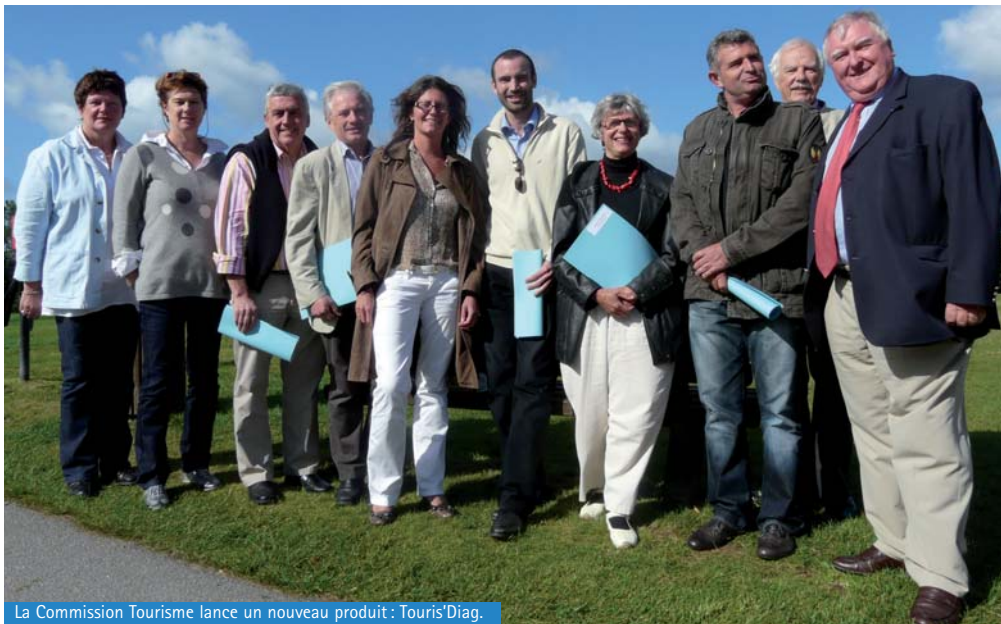
La Commission Tourisme lance un nouveau produit: Touris'Diag.

75 % des touristes utilisent Internet pour préparer leur voyage!