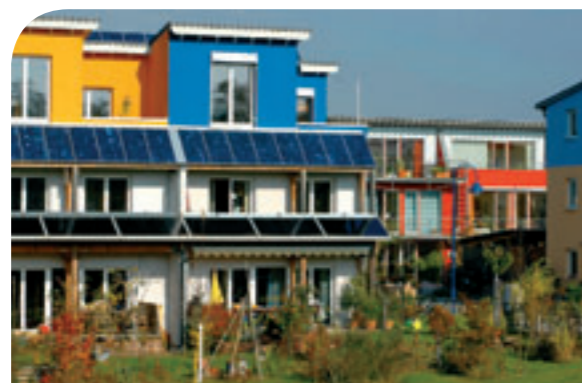
AMÉNAGEMENT HABITAT ET CADRE DE VIE