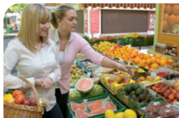
PRODUCTION ET CONSOMMATION RESPONSABLES