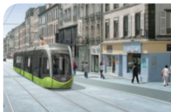
DÉPLACEMENTS ET TEMPS DE LA VIE